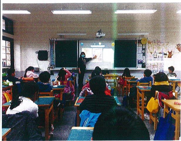
說明：三年級入班宣講情形