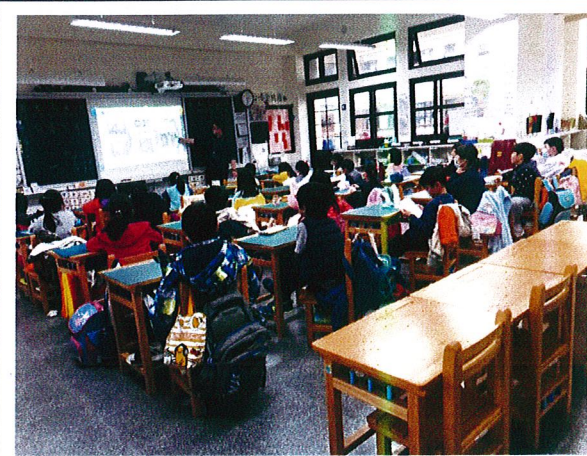
說明：三年級入班宣講情形