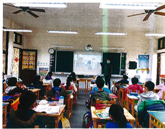
說明：三年級入班宣講情形