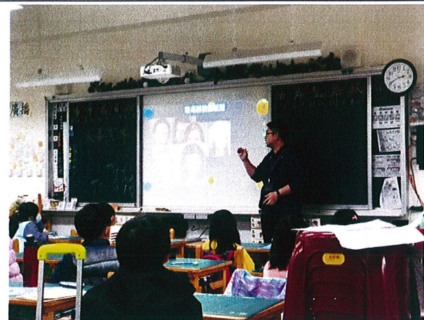
說明：三年級入班宣講情形