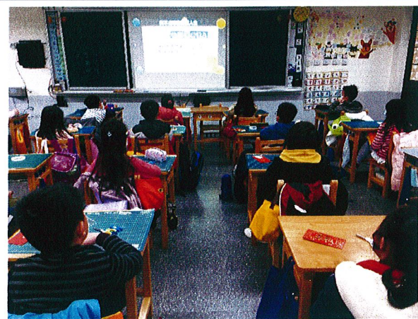
說明：三年級入班宣講情形