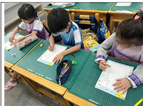
學生實際進行書信書寫練習，表達想法與感受。